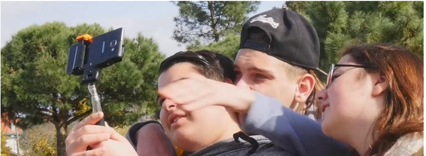
Atelier de réalisation de l'association lddb