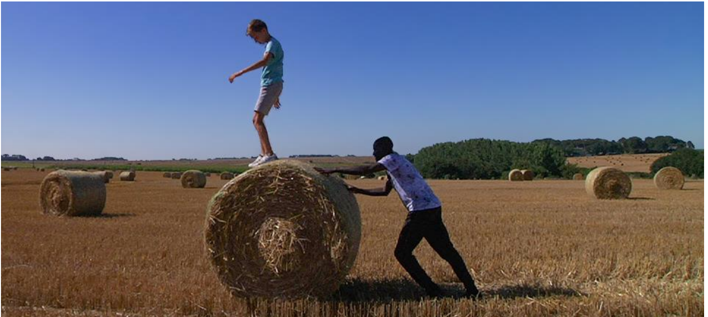
Green boys de Ariane Doublet

Le Mois du doc peut être l'occasion de faire découvrir le documentaire au jeune public, enfants et adolescents. Les films pourront être accompagnés d'un atelier-conférence, et certains par leurs réalisateurs. Une liste d'intervenants est proposée en fin de document pour la mise en place des ateliers pratiques.